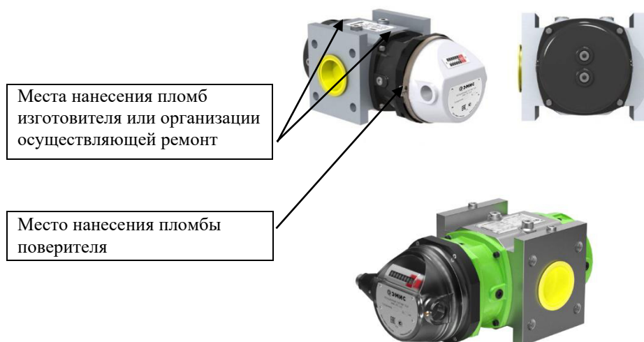
Рисунок 1 – Общий вид счетчиков и места нанесения пломб поверителя и пломб изготовителя или организации осуществляющей ремонт

Знак утверждения типа и заводской номер счетчика наносятся на маркировочную табличку, которая расположена сверху на корпусе ПП, методом фотолитографии и полиграфическим способом в буквенно-числовом формате, места расположения показаны на рисунке 2.